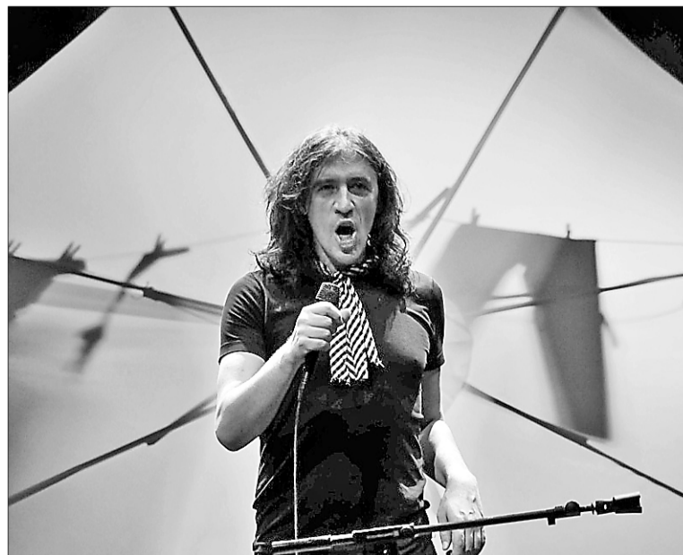
► Gerard Quintana presentará esta noche en Tarragona su cuarto trabajo en solitario 'Deterratenterrat', en el Metropol.